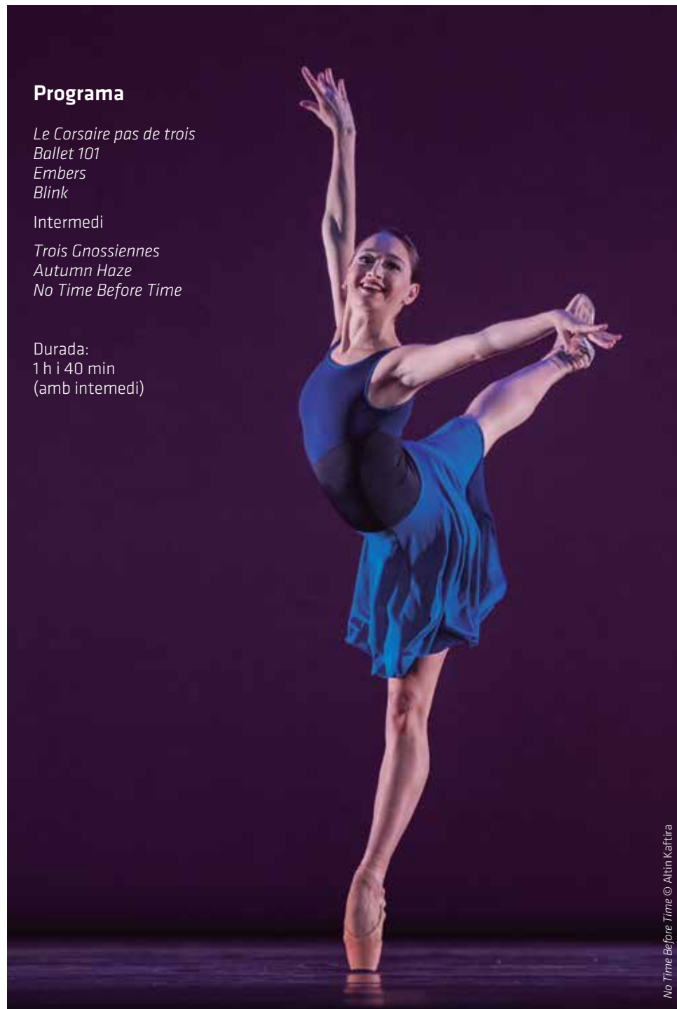
No Time Before Time © Altin Kafitra