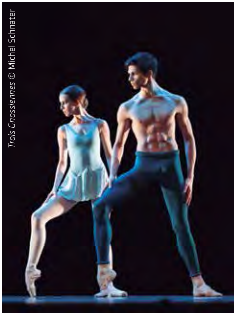
Trois Gnessiennes © Michel Schnater