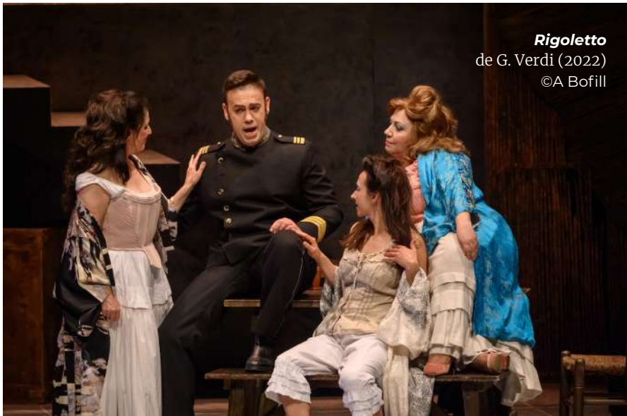
Rigoletto de G. Verdi (2022)