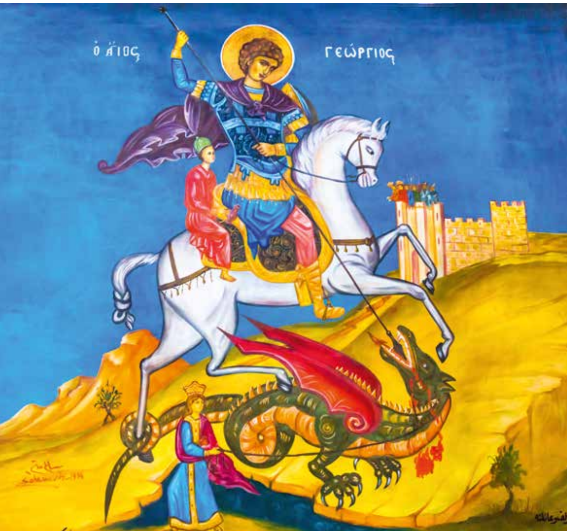
Fresc de Sant Jordi i el dragó a l'església Madaba de Jordània