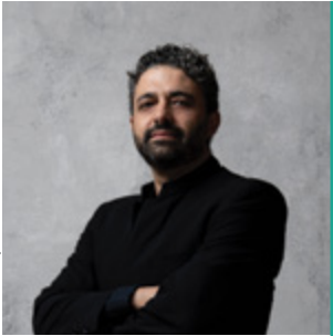
MANUEL COVES DIRECTOR MUSICAL

Ha ballat la majoria dels ballets clàssics i neoclàssics, treballant amb gran part dels grans coreògrafs del segle XX, com ara Maurice Béjart, Pina Bausch, Mats Ek i William Forsythe. Com a coreògraf, ha creat Mi favorita (2002 i 2006), Delibes-Suite (2003), Scaramouche , Parentesis 1 (2005), Soli-Ter , El olor de la ausencia (2007), Les Enfants du Paradis per al Ballet de l'Òpera de París (2008), Ouverture en Deux Mouvements i Scarlatti pas de deux (2009), Marco Polo , The Last Mission per al Ballet de Xangai (2010) i Resonance per al Boston Ballet (2014). És Comendador de l'Ordre de les Arts i les Lletres de França i Premi Nacional de Dansa 1999. Des de 2011 dirigeix la Companyia Nacional de Dansa.