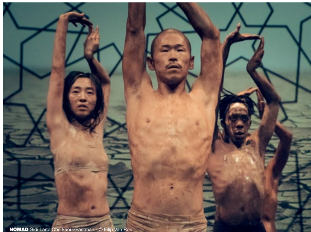
NOMAD Sidi Larbi Cherkaoui/Eastman